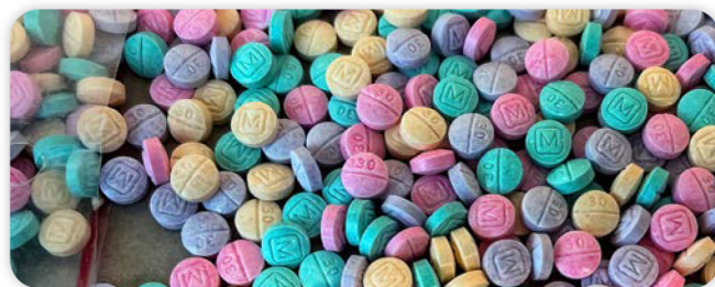
*Pastillas arcoíris FALSIFICADAS de oxycodona M30 que contienen fentanilo